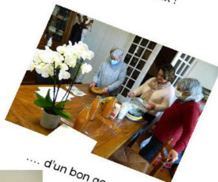
.... d'un bon gouter, sans oublier... !!