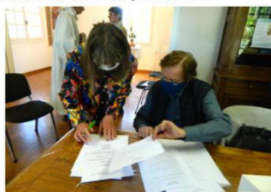
À l'issue de cette belle célébration, c'est le temps des signatures et....