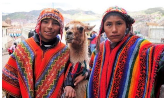
Carte du Pérou, visages de jeunes péruviens, colline de Lima