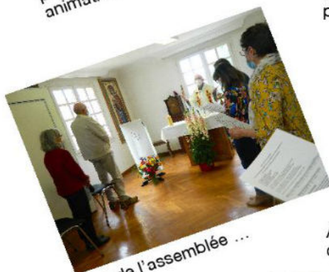
Une vue de l'assemblée ...