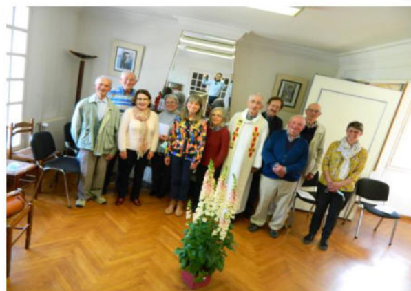
...La photo de groupe !